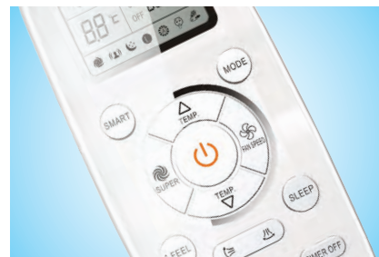
Удобный современный пульт